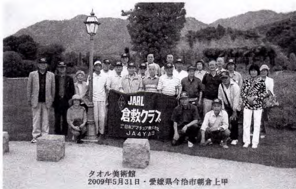
タオル美術館 2009年5月31日・愛媛県今治市朝倉上甲

今回の移動では当地のハム JA5IOE, JH5AYG, JH5GEN 各局に色々お世話になりました。