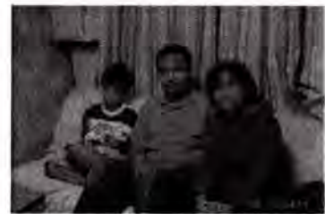
画像左から息子交換学生 XYL

仕事上施設の保安全管理（メンテナンス）業務を担当していることで時間の変則や家庭サービスを行っている事情から時々参加になると思いますがたった一つの楽しみであるハムライフの趣味を生涯続けて行こうと思っています。