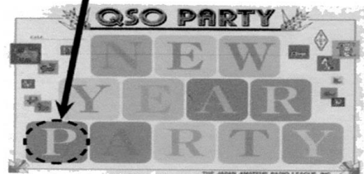
▲ JARL 販売係で入手できる台紙 (514 円送料込み、ゆうメール)